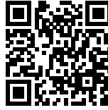
QR Código generación

Giro: 62090 - Otras actividades de tecnología de información y servicios de computadora Dirección: 21 avenida Sur Plazuela Las Amapolas, Residencial Primavera No 24. La Libertad Teléfono: 78362949 Correo: silvachavarria@gmail.com NRC: 3454250 NIT: 06231106241035